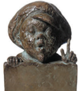
Med prisen følger en statuette lavet af billedhuggeren Hanne Varming.

Foreningen "Grønlandske Børn" vil bruge de 50.000 kroner til en bog, hvor grønlandske børn kan fortælle deres historie via digte, fotos, tegninger eller ord.