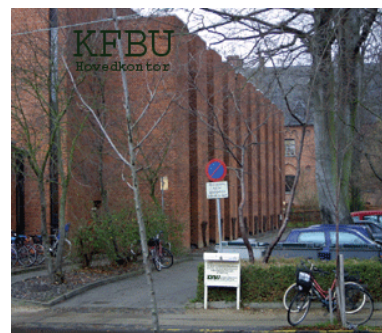
KFBU's hovedkontor på Frederiksberg.

Foreningen ønsker alle en rigtig dejlig og afslappende sommerferie, med mange gode oplevelser. Håber I får tid til fordybelse og ro, så efteråret bliver mødt med energi og med mod til nye udfordringer.