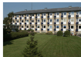
Alexandrakollegiet i Valby

gensidigt anvende de eksperter og muligheder vi hver i sær har. Vi har derfor nu udstukket rammerne for en sammenlægning af Familieplejen i KFBU og Familieplejen for børn og unge. Det betyder, at medarbejderne i Familieplejen i KFBU d. 1/4 2006 flyttede til FABU og fremover udfører deres arbejde herfra.