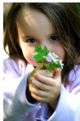
Sommeren er begyndt at titte frem, og både børn og blomster springer ud med ny energi og mod på livet.

Vi håber på denne måde at kunne gi' en bred information om, hvad der sker i foreningen og medvirke til, at foreningens repræsentantskab, bestyrelser, forstandere, medarbejdere, samarbejdspartnere og de mange personer, som på den ene eller anden måde er engagerede i og har tilknytning til foreningen, løbende bliver opdateret.