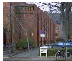
Hovedkontoret på Dronningensvej på Frederiksberg.