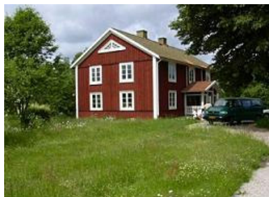
Böket i Sverige.