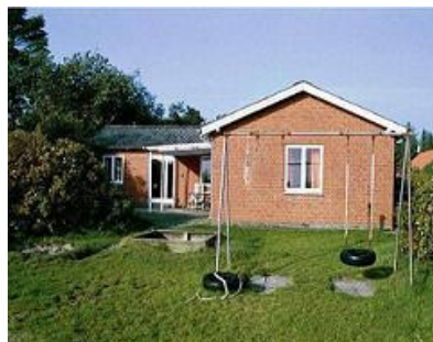
Aggerbo i Thy.